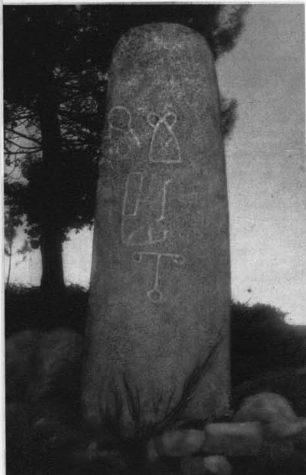
Est. II - (A - Face sul da estela, preparada pelo método bi cromático. [R. IX/75-17])

Entre a estela-menir e uma casa que se ergue a cerca de 20 metros a poente, dispõe-se um alinhamento de pequenos monólitos de granito, não excedendo em