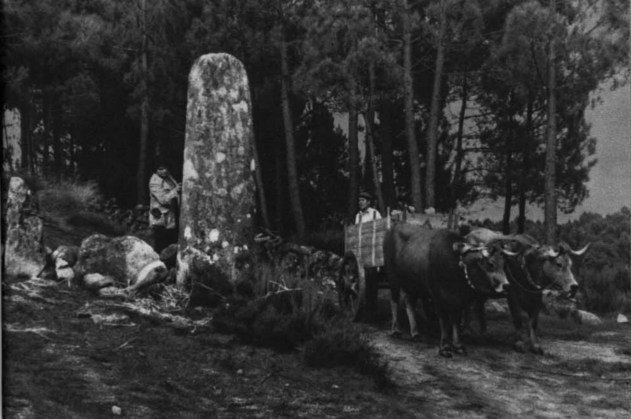
Est. 1 - (A - A estela-menir da Caparrosa, vista de sul [R. VIII / 75-26])