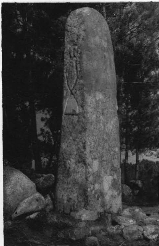
Est. II - (B - Perfil Oeste da estela-menir da Caparrosa [R. X | 75-3])