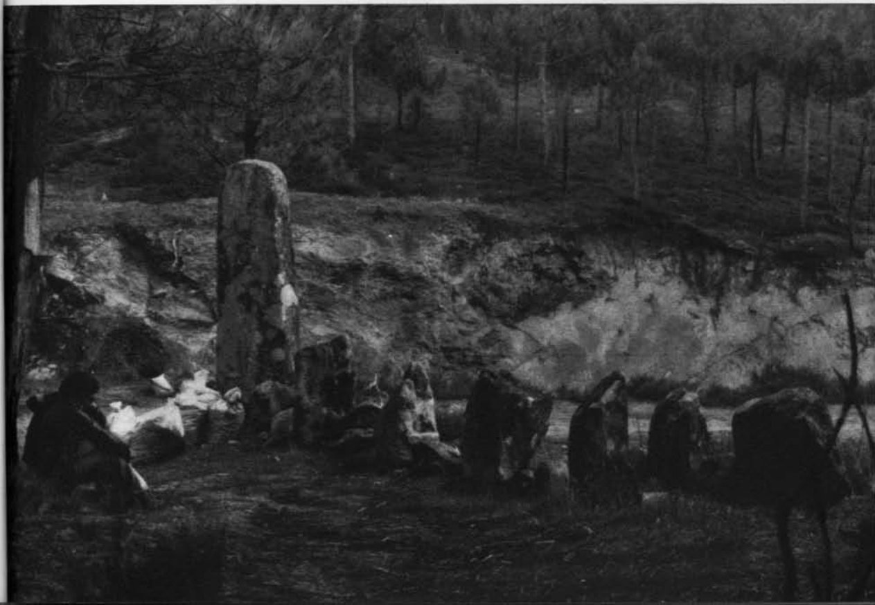
Est. 1 - (B - Estela-menir da Caparrosa e alinhamento de monólitos, vistos do quadrante oeste [R. VIII / 75-6])